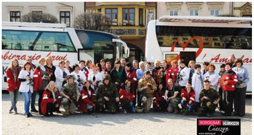
Pamiątkowe zdjęcie uczestników dwunastej akcji krwiodawstwa „Maturzysto! Zdaj egzamin dojrzałości z... życia”.

Chęć udziału w akcji zgłosili maturzyści z 13 następujących szkół powiatu cieszyńskiego: Liceum Ogólnokształcące im. A. Osuchowskiego z Cieszyna, Liceum Ogólnokształcące im. M. Kopernika z Cieszyna, Zespół Szkół Ekonomiczno – Gastronomicznych z Cieszyna, Zespół Szkół Budowlanych z Cieszyna, Zespół Szkół im. Wł. Szybińskiego z Cieszyna, Zespół Szkół Technicznych z Cieszyna, Liceum Ogólno-