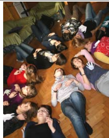
W ciągu dziesięciu lat działalności z Centrum Wolontariatu współpracowało blisko 1000 wolontariuszy.

Również w 2011 r. w Centrum Wolontariatu i Klubie Młodzieżowym „Graciarnia” były realizowane trzy projekty: „Mały gest wielka sprawa - cieszyński wolontariat” (z którego filmik można zobaczyć pod linkiem znajdującym się na www.bycrazem.com ), „Wakacyjna Akademia Współpracy” - realizowany z Domem Dzieci i Młodzieży z Czeskiego Cieszyna oraz „Akademia Liderów Młodo-