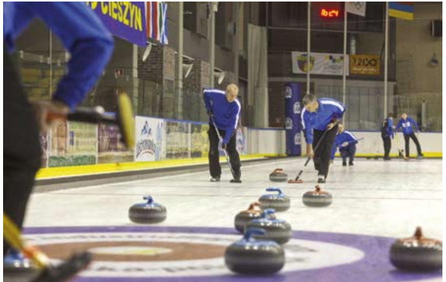
W ciągu trzech dni rozgrywek w curlingu Silesian Grand Prix rozegranych zostało 75 meczów.

Silesian Grand Prix to 3 dni rozgrywek, w trakcie których zostało rozegranych 75 meczów, wiele interesujących endów wzbudzało mnóstwo