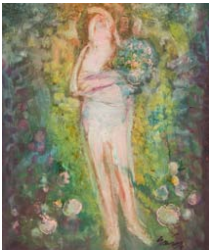
Na wernisaż wystawy trwającej do 27 maja zapraszamy 18 kwietnia o g. 17.00.

Muzeum Śląska Cieszyńskiego zaprasza serdecznie w dniu 18 kwietnia o godzinie 17.00 do Galerii Wystaw Czasowych na wernisaż wystawy prac Władysława Śmigi.