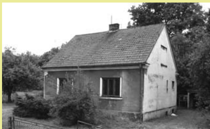
Nieruchomość przy ul. Frysztańskiej 155 przeznaczona do sprzedaży.

Burmistrz Miasta Cieszyna ogłasza, że w dniu 30.04.2012 r. o godz. 10.00 odbędą się rokowania na sprzedaż nieruchomości oznaczonej jako działka nr 24, obr. 78 o pow. 1664 m 2 , obj. KW Nr BB1C/00018923/3 Sądu Rejonowego w Cieszynie, zabudowanej budynkiem mieszkalnym jednolokalowym będącym własnością Gminy Cieszyn, położonym przy ul. Frysztańskiej 155 w Cieszynie.