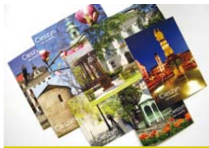
Zestaw kolorowych pocztówek z zdjęciami Cieszyna otrzyma się za wypełnioną ankietę dotyczącą informacji o wydarzeniach kulturalnych.

UWAGA! Za każdą wypełnioną ankietę można bezpłatnie otrzymać komplet ośmiu pięknych, pamiątkowych widokówek z Cieszyna. Pocztówki można odebrać po oddaniu wypełnionej ankiety w Cieszyńskim Centrum Informacji lub Wydziale Promocji i Informacji.