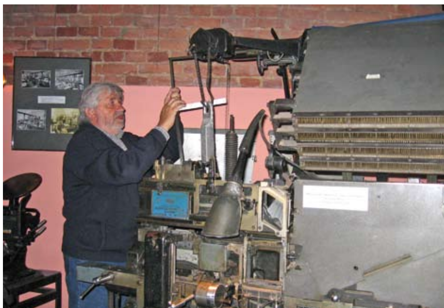
Muzeum Drukarstwa, w którym znaleźć można działające, zabytkowe maszyny drukarskie, zostało wyremontowane, zyskało nowe wejście i otwarto w nim również galerię.