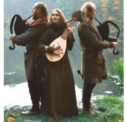
Muzykę świecką i sakralną wczesnego średniowiecza zaprezentuje Zespół Muzyki Dawnej Tryzna.

Cieszyński Ośrodek Kultury „Dom Narodowy” kontynuuje cykl pn. „ MUZYKA I PIEŚNI ŚREDNIOWIECZNEJ EUROPY ”. Już 27 kwietnia w Kościele oo. Bonifratrów (pl. Londzina 1) odbędzie się pierwszy w tegorocznej edycji koncert. Wystąpi Zespół Muzyki Dawnej „TRYZNA” ze Szczecina.