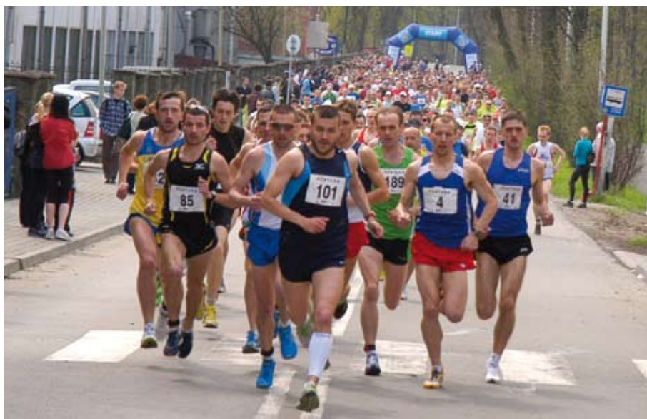
Cieszyński FORTUNA Bieg organizowany jest już po raz czwarty. Biegacze będą musieli pokonać trasę o długości 10 km.