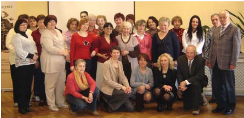
Kursanci wraz z pracownikami Biblioteki i wolontariuszami, czyli uczestnicy projektu „Information for the people – cybernawigatorzy w bibliotekach”.

W miarę zapotrzebowania odbywały się też konsultacje i szkolenia indywidualne, podczas których kursanci, pod okiem „cybernawigatorów”, mogli pogłębiać wiedzę z zakresu obsługi