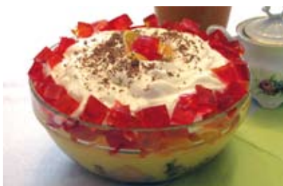
Deser „Legumina”.