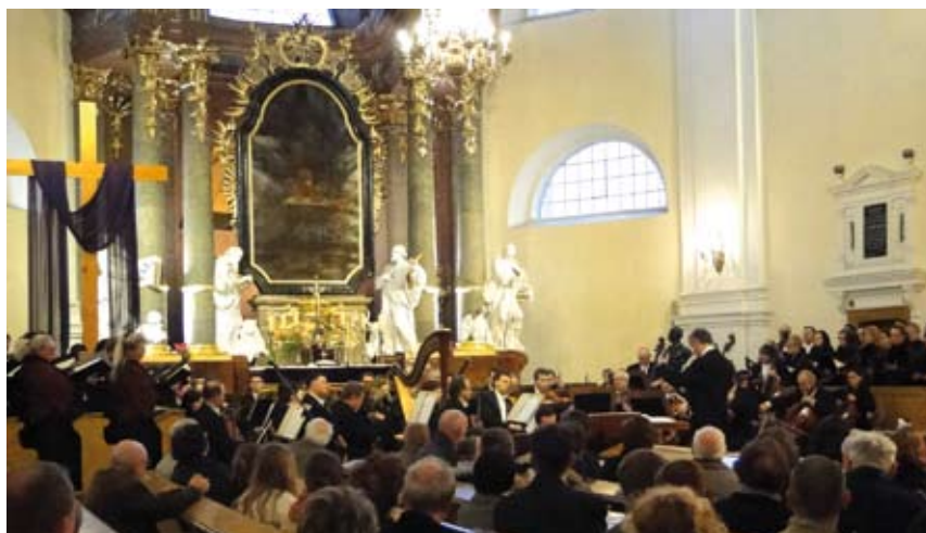
W tym roku, na 11 edycji koncertu wykonane zostało jedno z najwybitniejszych dzieł muzyki sakralnej Gabriela Urbain Fauré.