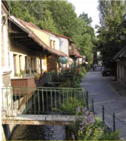
Urokliwa Cieszyńska Wenecja stanie się przestrzenią dla wystawy malarstwa i rzeźby.